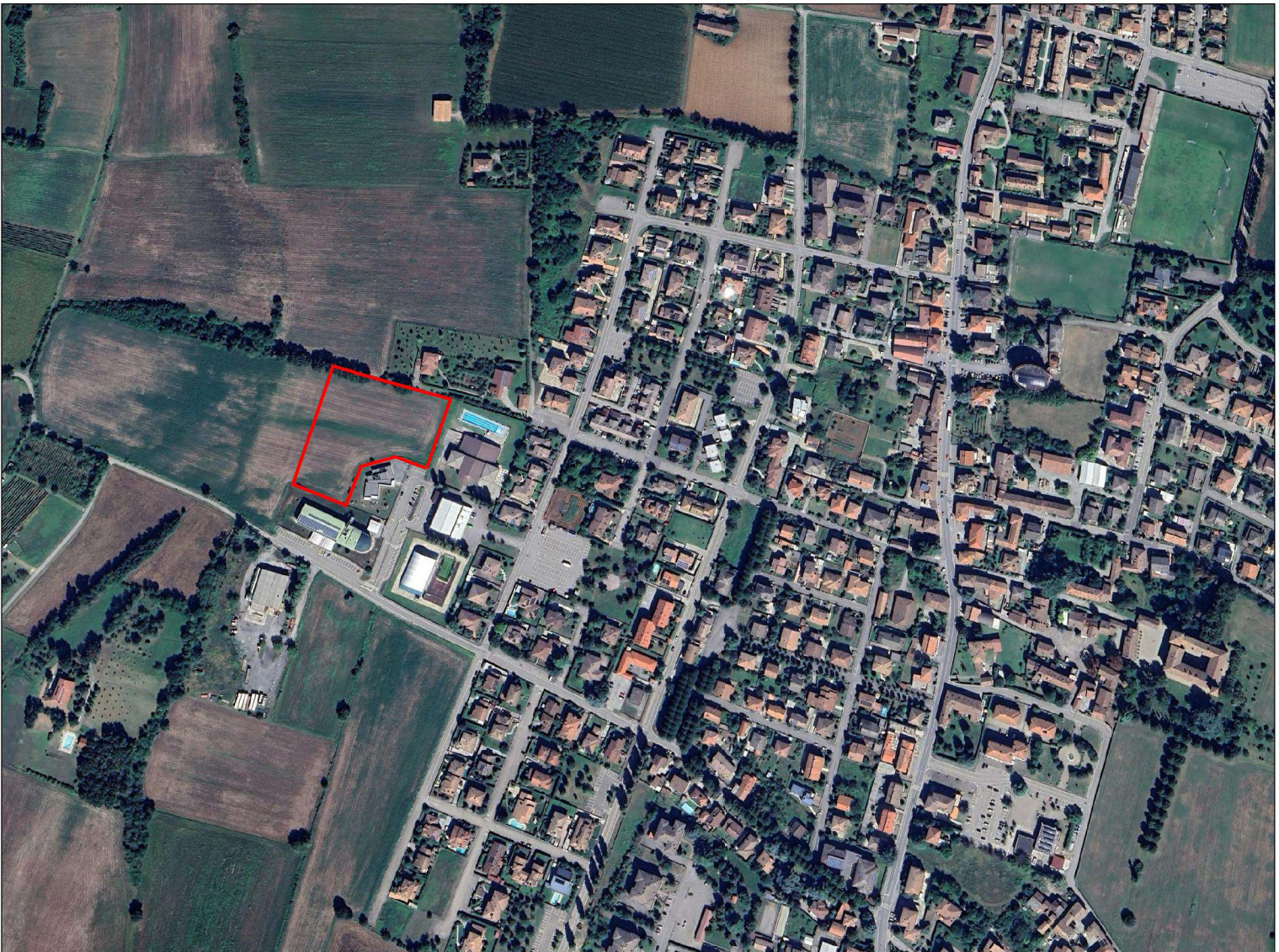
Individuazione dei fabbricati oggetto di intervento in ortofoto